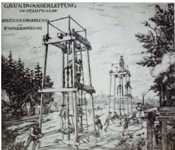
2 Grundwasserleitung: Eine gute Wasserversorgung ließen sich die Frankfurter Bürger gern etwas kosten. Neben dem aufwendigen Bau einer Quellwasserleitung, die Wasser aus dem Vogelsberg lieferte, bohrte die Stadt auch nach Grundwasser im Stadtwald. Bedürftige Bürger erhielten das Wasser zu einem reduzierten Preis oder wurden kostenlos beliefert.